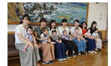
育休スタッフ & 赤ちゃん 大集合!!

法改正などに応じ、関係する就業規則等を迅速に改正しています。介護、育児休業、看護休暇などの諸制度を整備しています。隣接する倉敷記念病院の保育所利用もできます。（※定員など諸条件あり）