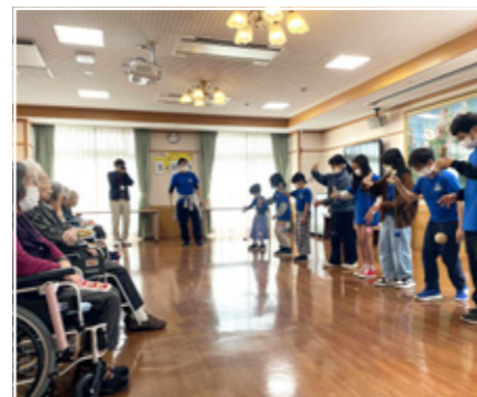
中島学童保育訪問