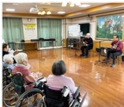
G'z (ジーズ) 訪問