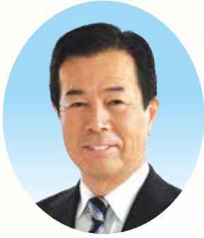
岡山県議会議員 ますみ会 理事