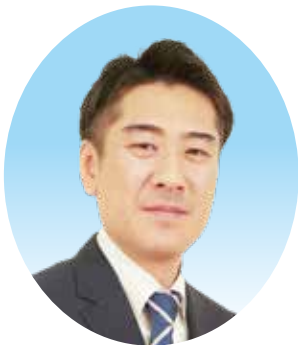
特別養護老人ホームますみ荘 施設長

しかし、時代は移り制度が変わろうともお年寄りの幸せを願う気持ちは変わらず、老いて心身を病みながらも日々を生きぬいてこられたお年寄りには尊敬と励ましが必要です。私たちは慈愛・奉仕・誠実・平等の初心を忘れず、不易流行の精神をもって次の時代に挑戦してまいります。