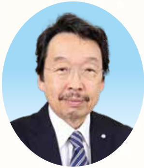
社会福祉法人ますみ会 理事長