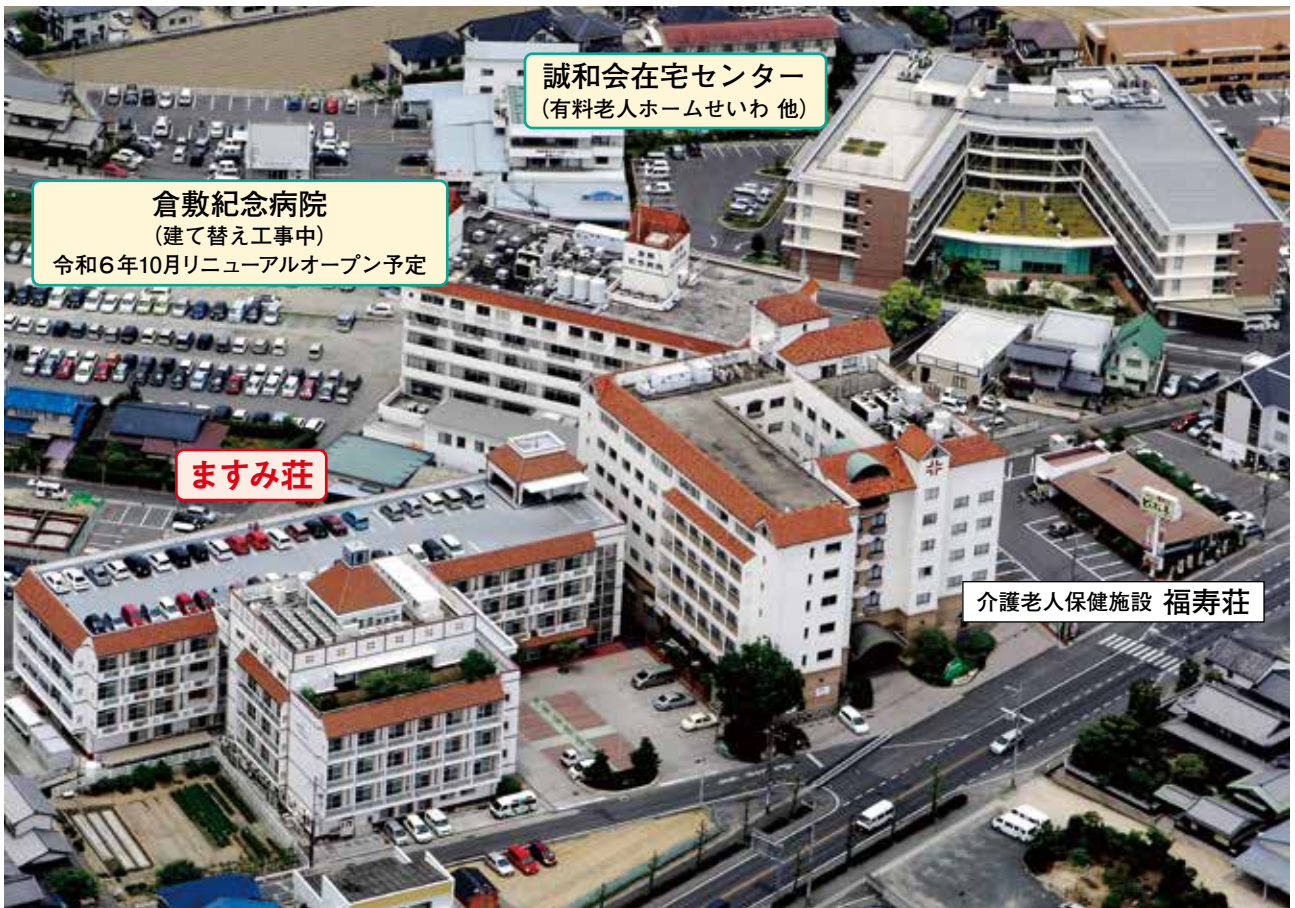
倉敷記念病院 （建て替え工事中） 令和6年10月リニューアルオープン予定