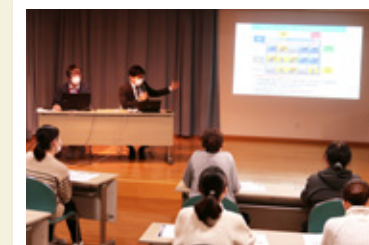
全体構成・機器取扱いの職員研修