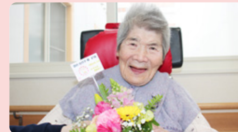
お花を見ると、皆さん笑顔になりますね