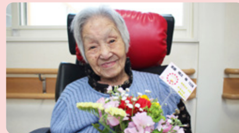
毎月誕生日を迎えるご利用者様に、家族会よりお花のプレゼント