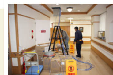
整備工事が進んでいます