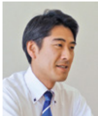
特別養護老人ホーム ますみ荘 施設長