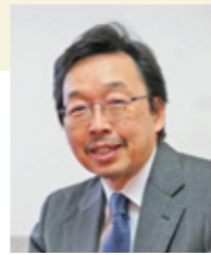
社会福祉法人 ずみ会 理事長

さて、今年の干支は卯です。ウサギは長い大きな耳と広い視野の目を持って情報収集と判断能力に優れ、危険察知すれば脱兎の如くと称される俊敏さと天下一品の跳躍力を持ち、卯年は飛躍の年ともいわれます。2023年が、ずみ会の飛躍の年となることを祈念します。そしてまた、私たちの生活も今までの数年間のコロナの軛から解かれて大きく「向上」する年になることを願って新年のご挨拶といたします。