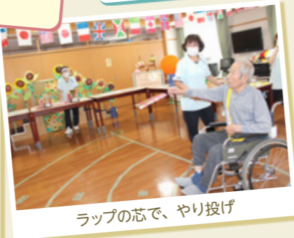
ラップの芯で、やり投げ