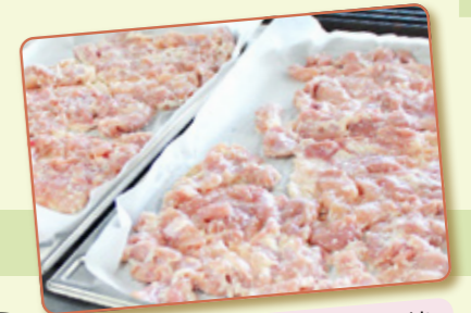
2時間漬けてからオープンで焼きます

ますみ荘でも、手作りした塩麹を使った料理メニューがいくつかあります。肉や魚を塩麹に漬けて焼く塩麹焼き、塩麹で野菜などを和える塩麹和え、その他にも調味料として幅広く使っています。塩麹に肉を漬け込むことで、肉の筋原線維を分解して、肉が軟らかくなり噛む力が弱い方でも食べやすくなります。そして何より美味しくなります。食材を美味しくする機能のほかにも、塩麹には生体調整機能も期待されており、とても魅力のある調味料です。これからも塩麹をうまく使いながら、美味しい食事を作っていきます。