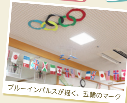
ブルーインパルスが描く、五輪のマーク

あの頃、家にはテレビが無かったけど、オリンピックを見るために、株で儲けたお金でテレビを買いました。そしたら、近所の子供達が『おばちゃん、テレビ見せて』とやって来るものだから、家を上らせて、おやつを出したりしたのを思い出すわ。