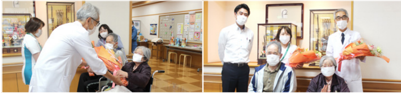
病院の日・看護の日