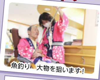
魚釣り 大物を狙います！