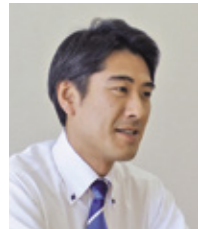
特別養護老人ホーム ますみ荘 施設長