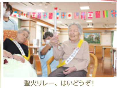
聖火リレー、はいどうぞ！