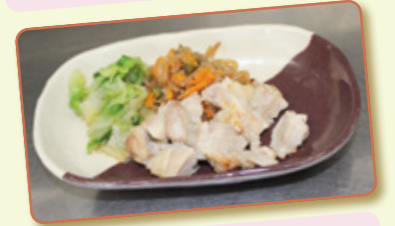
鶏肉の塩麹焼きのできあがり!