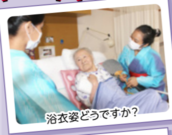
浴衣姿どうですか？