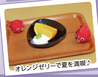
オレンジゼリーで夏を満喫♪