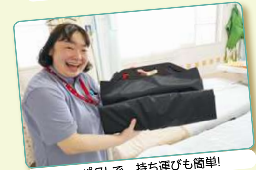
コンパクトで 持ち運びも簡単!