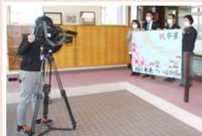
倉敷中央高校寄贈