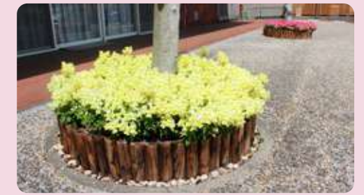
駐車場の花壇がリニューアルしました!