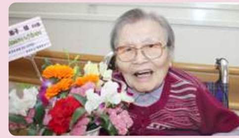
毎月誕生日を迎えるご利用者に、家族会よりお花をプレゼントしています