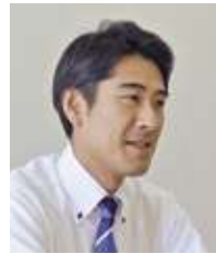
特別養護老人ホーム ますみ荘 施設長