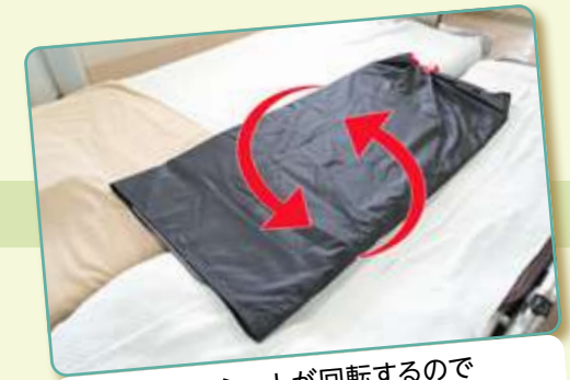
周りのシートが回転するので 軽い力で移動ができます

状態に合った福祉用具を選択し活用することで、「介護を受ける側」と「介護する側」双方に負担が少なく安全にやさしいケアが提供できます。福祉用具は、家庭向けのものもあります。ご家庭で福祉用具の使用をお考えの方は、担当のケアマネジャーにご相談ください。