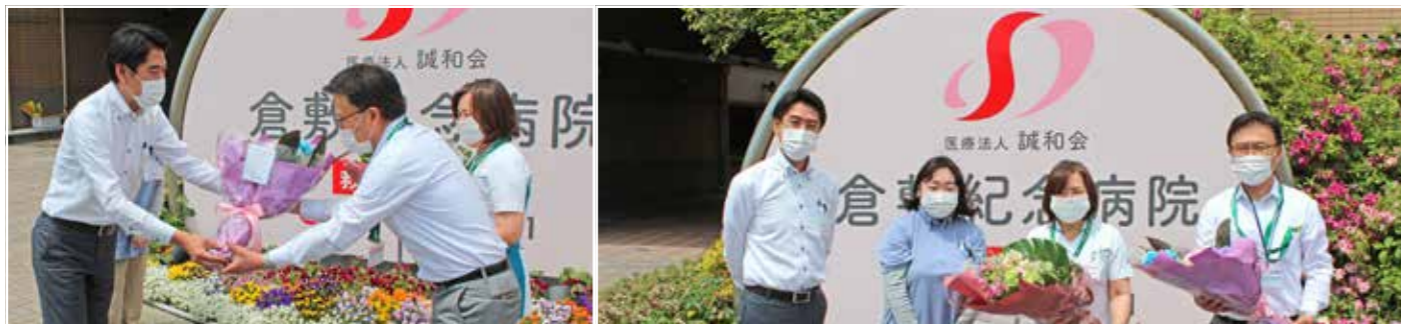
病院の日・看護の日