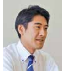
特別養護老人ホーム ますみ荘 施設長