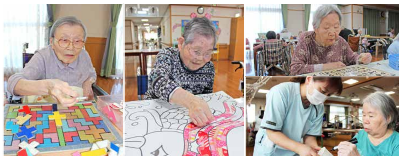
リハビリ風景 ※コロナ禍でも、荘内でできる行事を行っています。全てのご家族に毎月写真を送り、様子をお伝えしています。