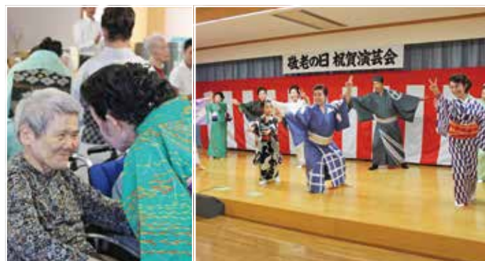
敬老の日演芸会 (扇蝶会)