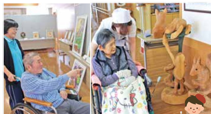
秋の家族会行事 (ますみ荘芸術祭)