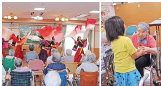
ベリーダンス 訪問