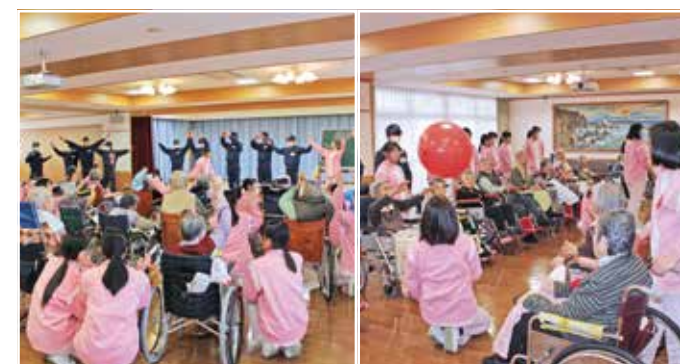
倉敷工業高校・倉敷中央高校ボランティア