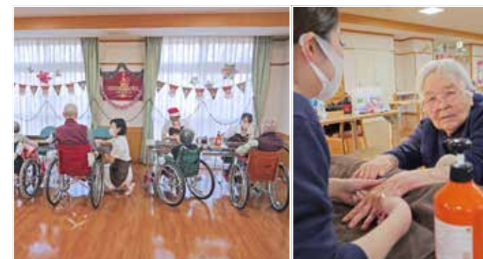
ハンドマッサージ (ココサロ)