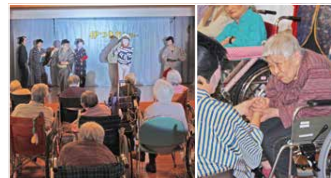
創立記念演芸会 (伊つき座)