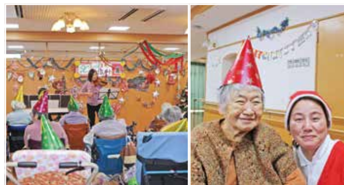
クリスマス・ミニコンサート