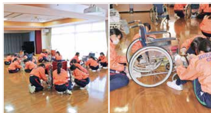
倉敷中央高校家庭科クラブボランティア