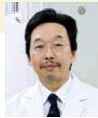
社会福祉法人 ますみ会 理事長

先人の言葉を借りれば、歴史は危機の時代を乗り切るための道標です。2025年、そしてその先の超高齢・人口減少社会の深化は医療・介護の危機の時代でもあります。幕末の危機を乗り越えて近代日本を創った明治の先人たちが示した信念と勇気と気概に学びたいと願う年頭です。