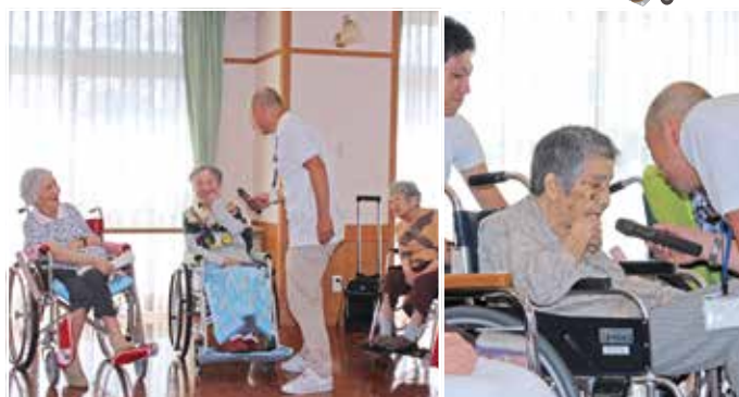
利用者の声を聴く会